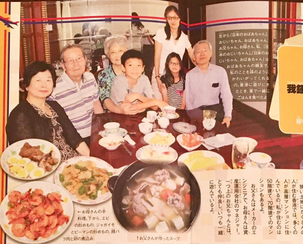
一お母さんの手料理。下から、エビの炒めもの、ジャガイモとピーマンの炒めもの、豚バラ肉と卵の煮込み 一お父さんが作ったスープ