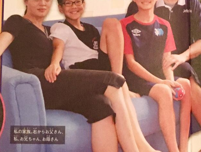
私の家族。右からお父さん、私、お兄ちゃん、お母さん

左から「日本のおばあちゃん、お兄ちゃん、おばあちゃん、お兄ちゃん、お母さん、私、「日本のおじいちゃん」、「日本のおばあちゃん、おばあちゃん」はおばあちゃんの親友で、私のことを孫のようにかわいがってくれるの。香港に遊びにきたとき、家で一緒にごはんを食べたよ