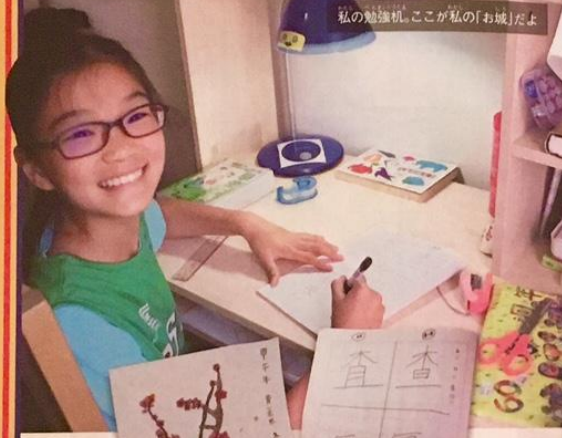
私の勉強机。ここが私の「お城」だよ