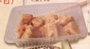
→魚のすり身が入っているシュウマイ、コンビニで気軽に買えるよ