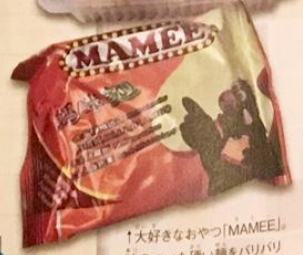
→大好きなおやつ「MAMEE」味のついた使い捨て箸をバリバリ割って食べるの